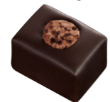
INTENSE Praliné au macaron