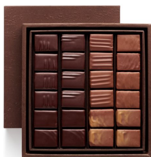
BBC 100 % PRALINE Coffret Taille 2 24 pcs - 46,44€ HT DLC : 1 mois