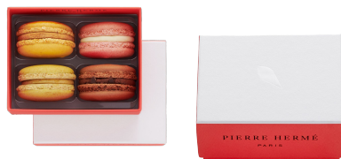
4 MACARONS 14,21€ HT DLC : 5 jours