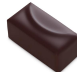
FLEUR DE CASSIS Ganache au cassis, Chocolat Noir