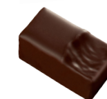
ELSA Ganache à la framboise et aux épices à pain d'épices, enrobée de chocolat noir