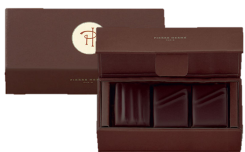
Coffret 3 BBC 3 pcs - 7,11€ HT DLC : 1 mois