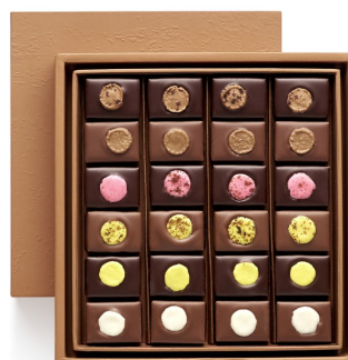
BBC MACARON Coffret Taille 2 20 pcs - 46,44€ HT DLC : 1 mois