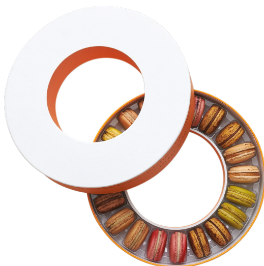
20 MACARONS Initiation 62,56€ HT DLC : 5 jours