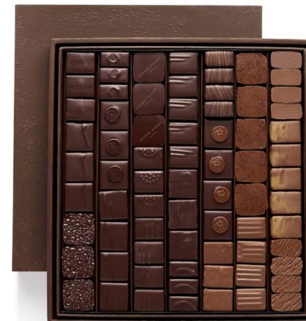
BBC Coffret Taille 5 73 pcs - 112,80€ HT DLC : 1 mois