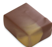
ACAJOU Praliné à la noix de coco & pâte de fruits au fruit de la Passion, Chocolat au Lait