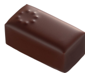
QUETZAL Chocolat Noir Pure Origine Bélize & Graines d'Amarante