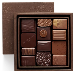
BBC Coffret Taille 1 12 pcs - 27,49€ HT DLC : 1 mois