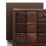
NOUGATINES Ispahan & Mogador 134g 17,06€ HT DLC : 1 mois