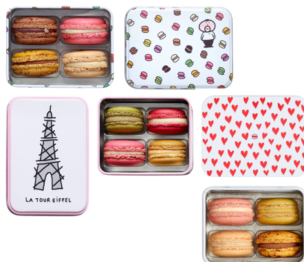
4 MACARONS Boîte métallique 15,17€ HT DLC : 5 jours