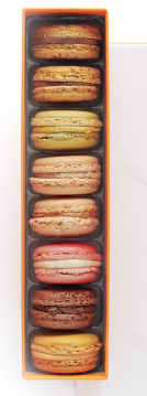
8 MACARONS 25,59€ HT DLC : 5 jours