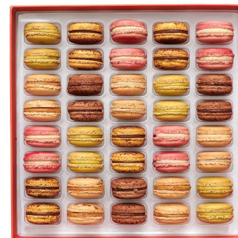
40 MACARONS 109,95€ HT DLC : 5 jours