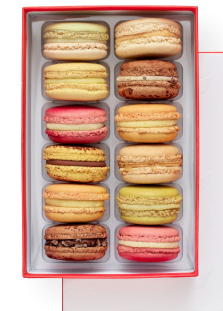
12 MACARONS 36,97€ HT DLC : 5 jours