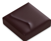
INFINIMENT CHOCOLAT BÉLIZE Ganache Pure Origine Belize - Chocolat Noir