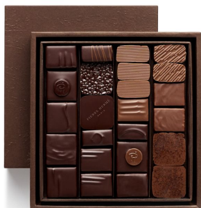
BBC Coffret Taille 2 24 pcs - 46,44€ HT DLC : 1 mois