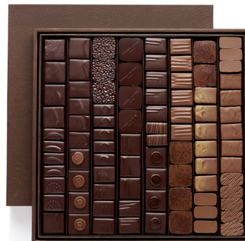
BBC Coffret Taille 6 89 pcs - 131,75€ HT DLC : 1 mois