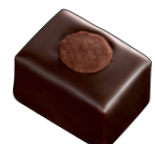
INFINIMENT PRALINÉ NOISETTE Praliné noisette fondant et croustillant