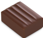
INFINIMENT PRALINÉ NOISETTE Praliné noisette, Chocolat au Lait