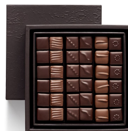
PH CUBES 36 pcs - 27,49€ HT DLC : 1 mois