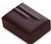
INFINIMENT PRALINÉ PISTACHE Praliné pistache, Chocolat Noir