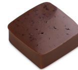
MOGADOR Ganache au fruit de la Passion, Chocolat au Lait