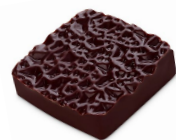
INFINIMENT HACIENDA ELEONOR Ganache au chocolat noir Pure Origine Equateur, Plantation Hacienda Eleonor