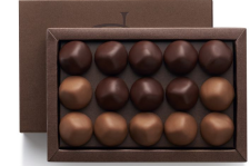
CROQUANTS PRALINÉS 130g 22,75€ HT DLC : 1 mois