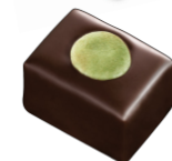
INFINIMENT PRALINÉ PISTACHE Praliné pistache, pistaches torréfiées