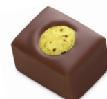
MOGADOR Ganache au fruit de la Passion, Chocolat au Lait