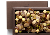
MENDIANTS LAIT 135g 18,33€ HT DLC : 1 mois