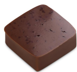
CHOC CHOCOLAT Ganache au chocolat amer et nougatine aux éclats de fèves de cacao, Chocolat Noir