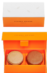
2 MACARONS 7,80€ HT DLC : 5 jours