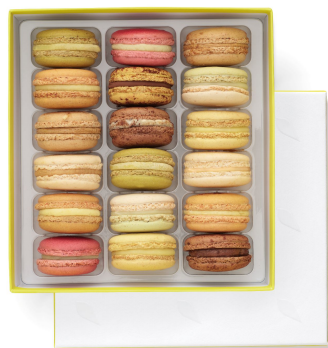
18 MACARONS 54,98€ HT DLC : 5 jours