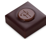
INFINIMENT VANILLE Ganache à la vanille, Chocolat Noir