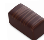
MAKASSAR Ganache au caramel beurre salé, Chocolat Noir