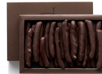
ORANGETTES 120g 20,85€ HT DLC : 1 mois