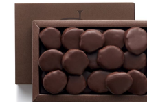
GINGEBRES CONFITS 130g 20,85€ HT DLC : 1 mois