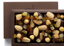
MENDIANTS NOIR 135g 20,85€ HT DLC : 1 mois