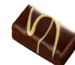
INFINIMENT CLÉMENTINE Pâte d'amande à la Clémentine de Corse, enrobée de chocolat noir