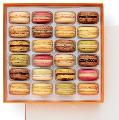
24 MACARONS 68,25€ HT DLC : 5 jours