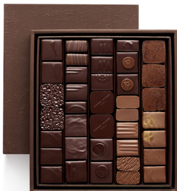
BBC Coffret Taille 3 38 pcs - 65,40€ HT DLC : 1 mois