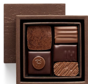
BBC Coffret Taille 0 5 pcs - 15,17€ HT DLC : 1 mois