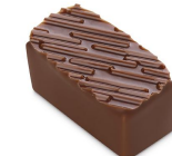
INFINIMENT CHOCOLAT AU LAIT Ganache au lait caramélisée, Chocolat au Lait