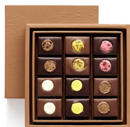
BBC MACARON Coffret Taille 1 12 pcs - 27,49€ HT DLC : 1 mois