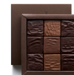
NOUGATINES Fhlor & Infiniment Caramel 134g 17,06€ HT DLC : 1 mois