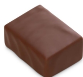
MATHILDA Praliné amande & citron, Chocolat au Lait