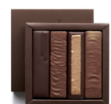
ABSOLUMENT 135g 22,75€ HT DLC : 1 mois