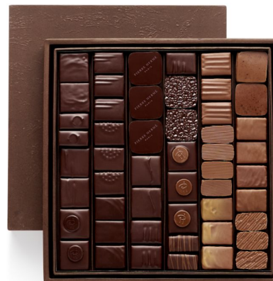
BBC Coffret Taille 4 53 pcs - 84,36€ HT DLC : 1 mois