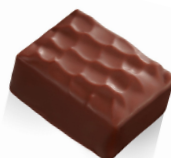
INFINIMENT PRALINÉ PIGNON DE CÈDRE Chocolat au Lait & Praliné Pignon de Cèdre