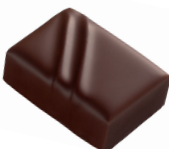
ENORA Praliné au Blé Noir & Chocolat Noir Pure Origine Venezuela Grand Cru Aguarani