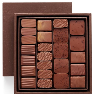
BBC 100 % LAIT Coffret Taille 2 24 pcs - 40.83€ HT DLC : 1 mois