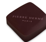
ISPAHAN Ganache à la framboise & pâte de fruits au letchi et à la rose, Chocolat Noir