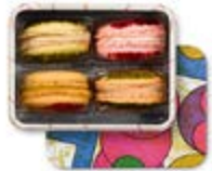
4 MACARONS Boîte métallique 13,74€ HT

Coffrets de 4, 8, 12, 18, 20, 24 ou 40 macarons