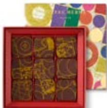
T1 avec transferts : 120g 23,70€ HT