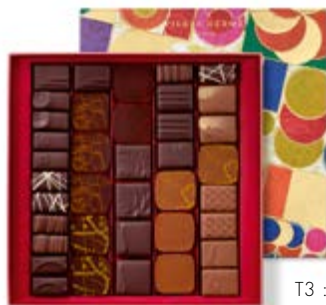
T3 : 350g 51,18€ HT