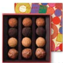
12 pièces 100g - 19,91€ HT