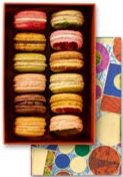
12 MACARONS Coffret 36,97€ HT