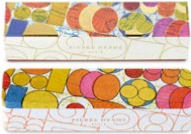
8 MACARONS Coffret 24,64€ HT Boîte métallique 27,49€ HT