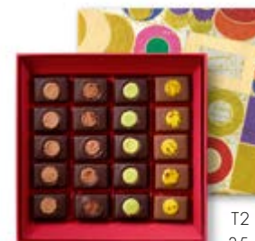
T2 : 240g 35,07€ HT