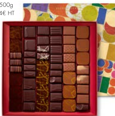
T4 : 500g 70,14€ HT