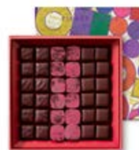
100g 26,54€ HT