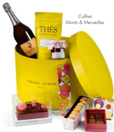
Coffret Monts & Merveilles