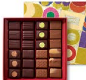
T2 Praliné : 210g 36,02€ HT