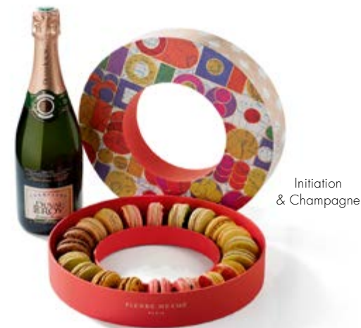
Initiation & Champagne