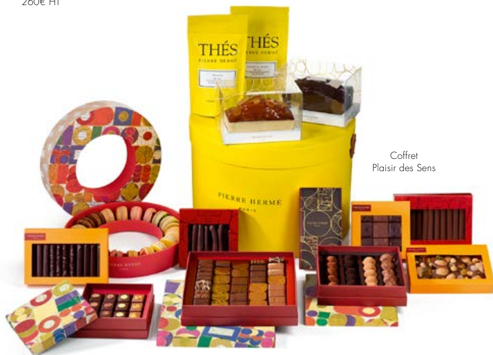
Coffret Plaisir des Sens

Une bouteille de Champagne Billecart Salmon Rosé, un coffret de 24 macarons, un coffret 350g Assortiment Bonbons de chocolat, un coffret de Bonbons de chocolat au macaron 20 pièces, un coffret de 20 truffes, un cake Ultime, un coffret Absolutement Lait, un coffret Absolutement Noir, un coffret d'orangettes, un coffret mendiant lait, un coffret de croquants Lait & Noir, une tablette fourrée infiniment Praliné Noisette, une tablette fourrée Pistache et Fleur d'oranger, un thé Jardin de Pierre en sachet, un thé Ispahan en sachet, une boule de Noël 2023, une confiture Ispahan, un cake Pain d'épices et Mandarine, un coffret de nougaines Ispahan et Mogador 590€ HT