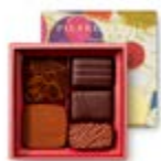
T0 : 60g 13,27€ HT