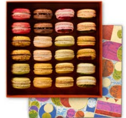
24 MACARONS Coffret 72,04€ HT