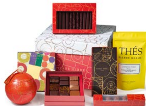
Coffret Explorations & Saveurs