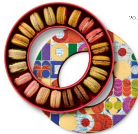
20 MACARONS INITIATION Coffret 62,56€ HT