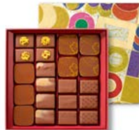
T2 100% lait : 210g 33,18€ HT