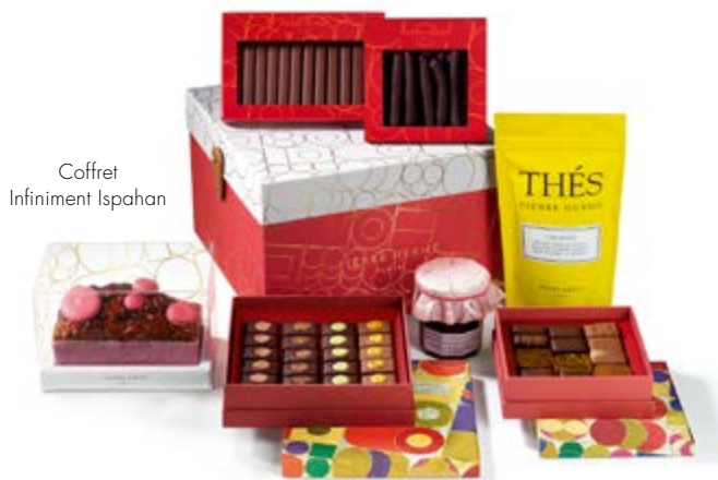
Coffret Infiniment Ispahan

Une bouteille de Champagne Billecart Salmon Rosé, un coffret de 8 macarons, un coffret 50g Assortiment Bonbons au chocolat, un cake Ispahan, une confiture Ispahan, un thé Ispahan 20 sachets 260€ HT