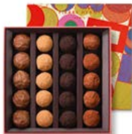
20 pièces 180g - 32,23€ HT