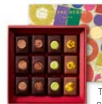
T1 : 140g 23,70€ HT

ASSORTIMENTS DE 12 OU 20 BONBONS DE CHOCOLAT AU MACARON