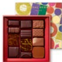
T1 : 120g 22,75€ HT