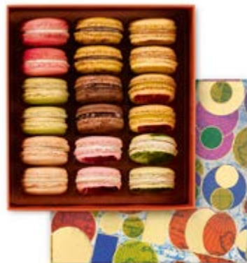
18 MACARONS Coffret 53,08€ HT