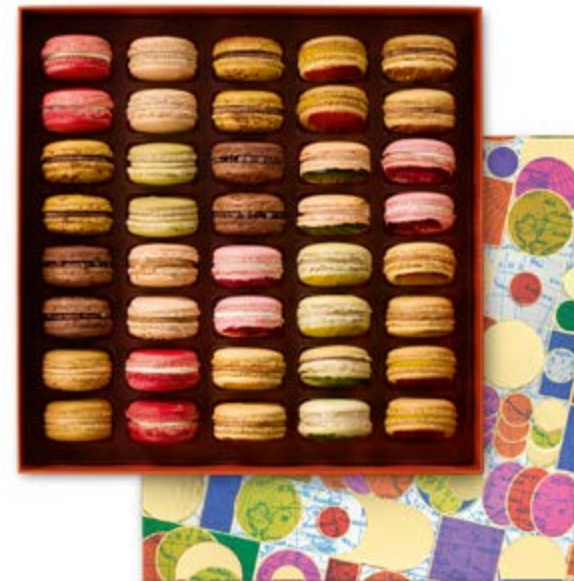
40 MACARONS Coffret 115,64€ HT