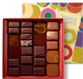
T2 : 210g 32,23€ HT