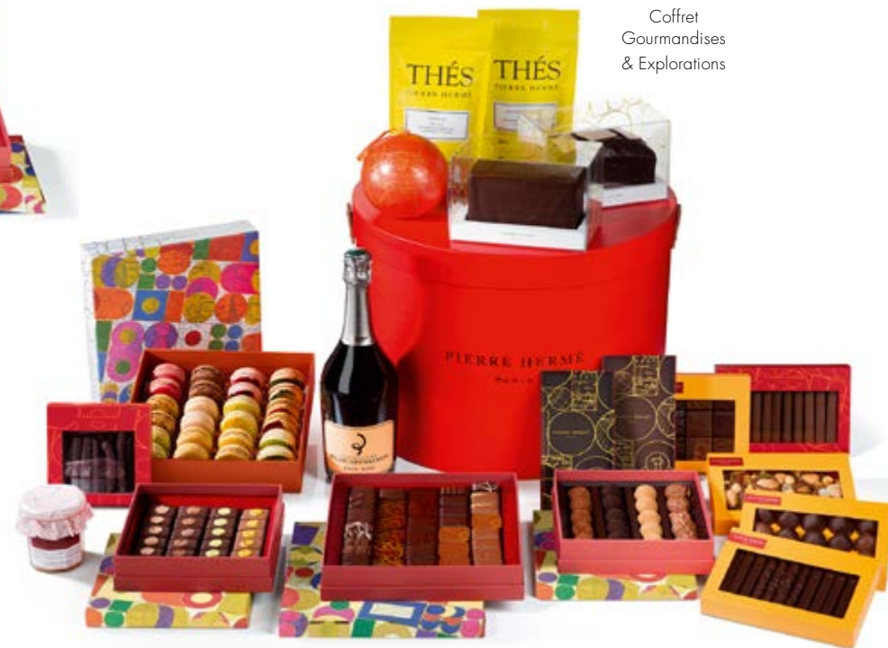
Coffret Gourmandises & Explorations

Un coffret Absolutement Lait, un coffret d'orangettes, un coffret 120g Assortiment Bonbons au chocolat, un coffret de Bonbons au chocolat au macaron 20 pièces, un cake Ispahan, une confiture Framboise et violette, un thé Cérémonie 20 sachets 170€ HT